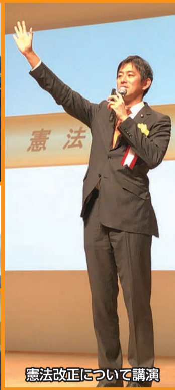
憲法改正について講演