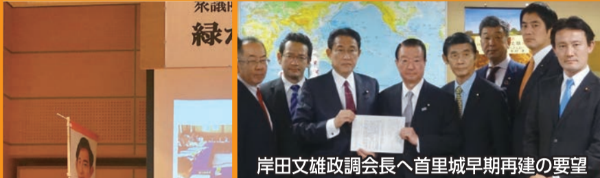
岸田文雄政調会長へ首里城早期再建の要望