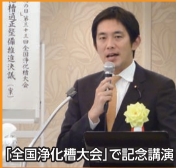
「全国浄化槽大会」で記念講演