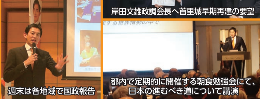
週末は各地域で国政報告