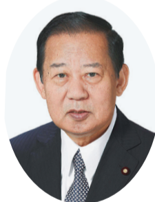
二階 俊博 幹事長

その道しるべとなるのが憲法です。国会議論を通 じ皆さまへの責任を果たしていく決意です。