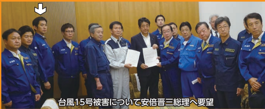
台風15号被害について安倍晋三総理へ要望