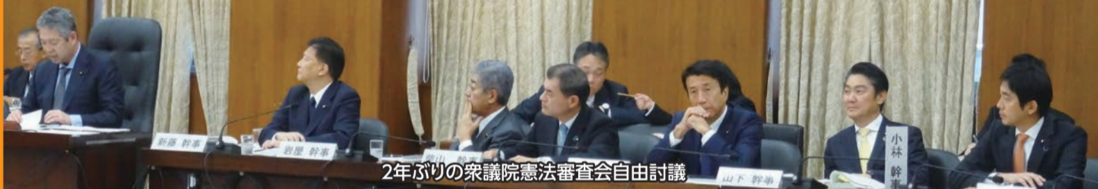
2年ぶりの衆議院憲法審査会自由討議