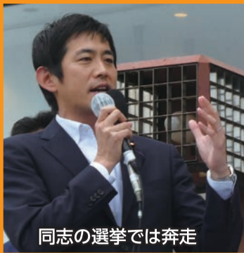
同志の選挙では奔走