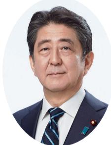
安倍 晋三 総裁

令和に入って2年目となる今 年、わが党は政権政党として、 引き続き山積する内外の諸課題 に真正面から向き合い、新しい 時代を、皆さまとともに切り拓 いてまいります。