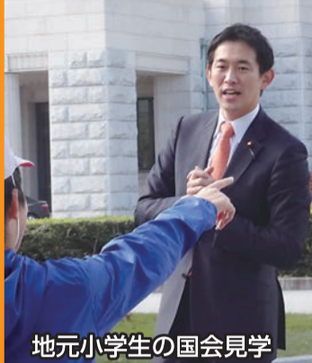
地元小学生の国会見学