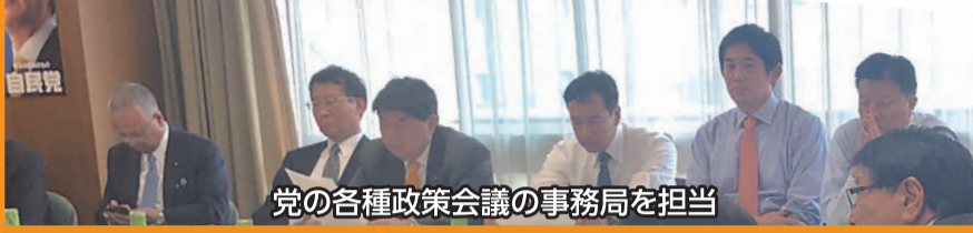
党の各種政策会議の事務局を担当