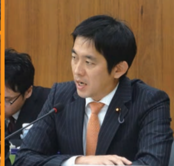
都内で定期的に行われる朝食勉強会にて、日本の進むべき道について講演