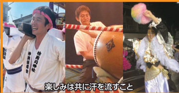
楽しみは共に汗を流すこと